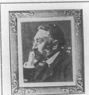
DON MIGUEL DE UNAMUNO.

Porque creer en Dios es, según Unamuno, querer que le haya, mientras por el contrario no creer en él es querer que