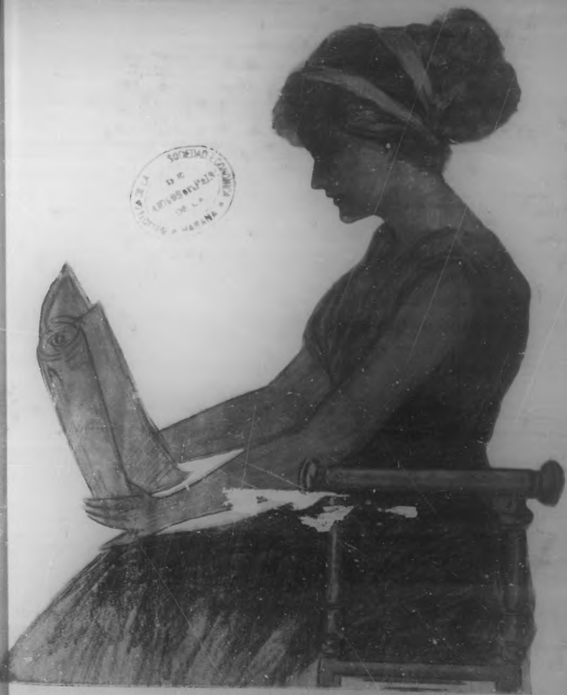
Dibujo de W. H. Brito.