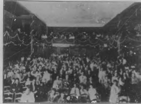
Aspecto del Salón teatro "Modernista" la tarde del 1.º de Febrero.

la energía de las voluntades de los adalides el periodista que en su prosa gallarda chispea la luz que ilumina las rutas y va la semilla de las bellas floraciones.