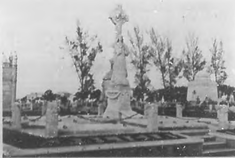
Panteón del Cuerpo de la Policía Nacional que ha sido inaugurado en el día de hoy en el Cementerio de Colón.

Acto seguido fueron pasadas por el lienzo dos Películas de la exclusiva de la "Cárdenas Film Renting Co." que llevan por títulos "Los peligros de la vida a través de un cuadro" y el "Poder infame de un hipnotizador" ambas proyecciones merecieron los aplausos de la concurrencia un tanto más con la aparición del "Cangrejo", marca de las Cintas de la "Cárdenas Film Renting Co." Después de haber sido obsequiados con licores, termi-