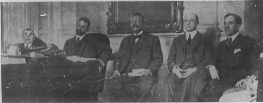
LAFIRMA DEL EMPRESTITO DE LOS 10 MILLONES.—Momentos de otorgarse la escritura del indicado préstamo. El general Menocal y el Secretario de Hacienda en unión de los Sres. Notarios y Representante de la casa de Morgan.

Ecos de la bella Ciudad de Cárdenas.—El domingo pasado a las 2 p. m., según estaba anunciado, se inauguró la "Cárdenas Film Renting Co." casa importadora de Películas y efectos de Cinematógrafos.