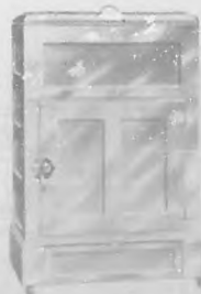
3 tamaños con Tanque $35 a $100, M. O.

Las hay también en forma cuadrada para los que la prefieren, que como las otras son todas de Metal garantizada y Esmalada en Blanco, inoxidable, atractiva y cómoda.